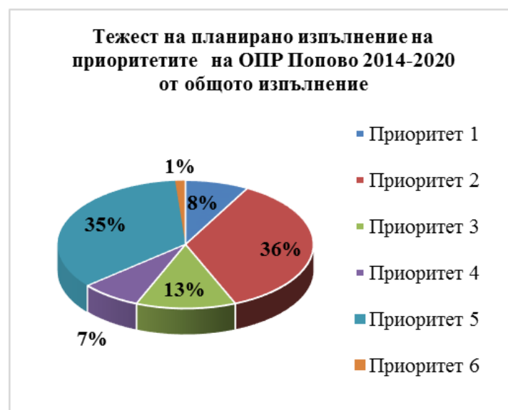
Фигура 1. Финансово изпълнение на приоритети от ОПР 2014-2020 г. до 2016 г.