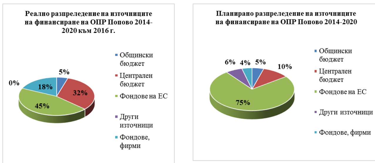
Фигура 2. Основни източници на финансиране на ОПР 2014-2020 за 2016 г.

Графично основните източници на финансиране за периода 2014-2016 г. са представени по-долу.