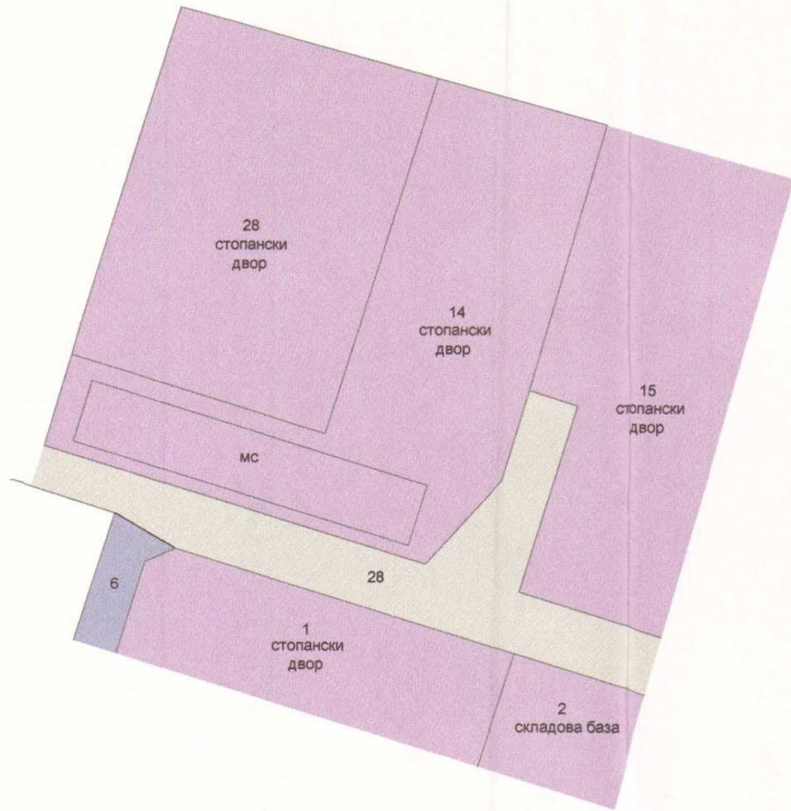
ПЛАН ЗА ЗАСТРОЯВАНЕ