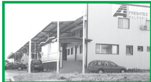
Фирмата „FreshTex“ засега е единственото предприятие на територията на общината, създадено изцяло с чужди инвестиции

Още за Общинския план за развитие – в следващия брой