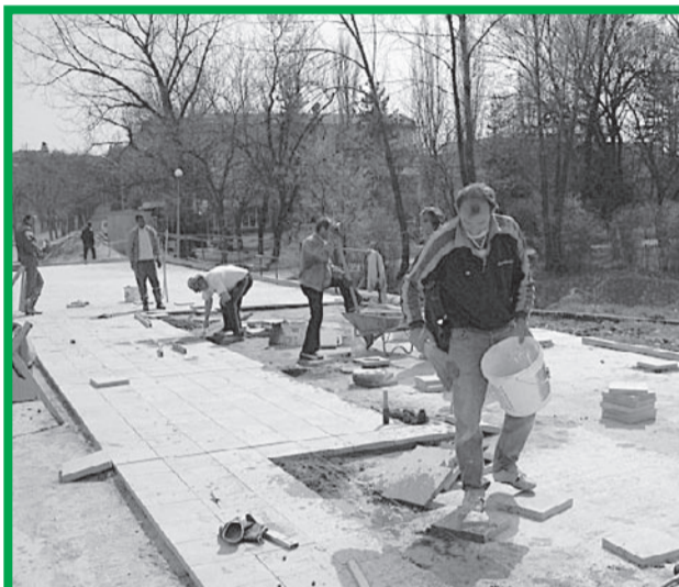
Повечето от малките благоустройствени и инфраструктурни проекти привличат чужди инвестиции, макар и малки по размер. Пред завършване е поредният от тях – по укрепване и разширяване на мост над река Поповска.

ОБЩНСКИ ПЛАН ЗА РАЗВИТИЕ НА ОБЩИНА ПОПОВО 2005–2006 Г.