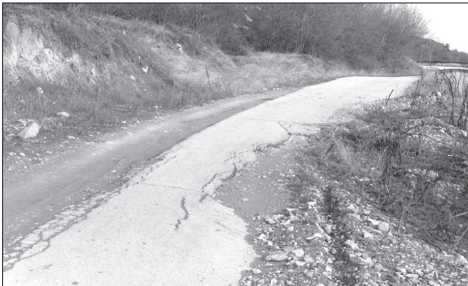
За съжаление все повече пътища от четвъртокласната пътна мрежа поради активизирани свлачища и невъзможност за нормална поддръжка очакват пари за възстановяване най-вече от фонд „Бедствия и аварии“