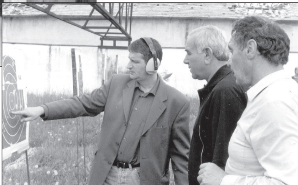
На стрелковия рубеж

Следващият стрелкови турнир ще се проведе през месец ноември тази година в чест на деня на св. Архангел Михаил, като негови домакини ще бъдат запасните офицери от Търговище.