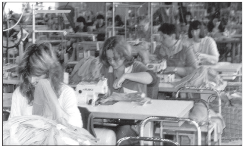
В шивашкия цех през тези дни се изработват облекла за испанската фирма „Зара“.