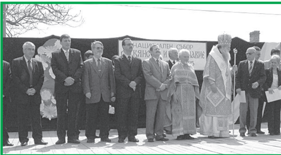
Част от официалните гости (отляво надясно):

Тържествата в селото продължиха през целия ден и в тях се включиха местни и гостуващи художествени състави.