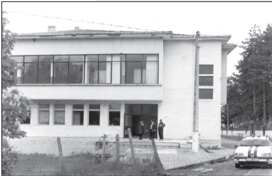
Ремонтираната и боядисана читалищна сграда в центъра на селото.

ние на децата, които са бъдещето на селото и страната ни.