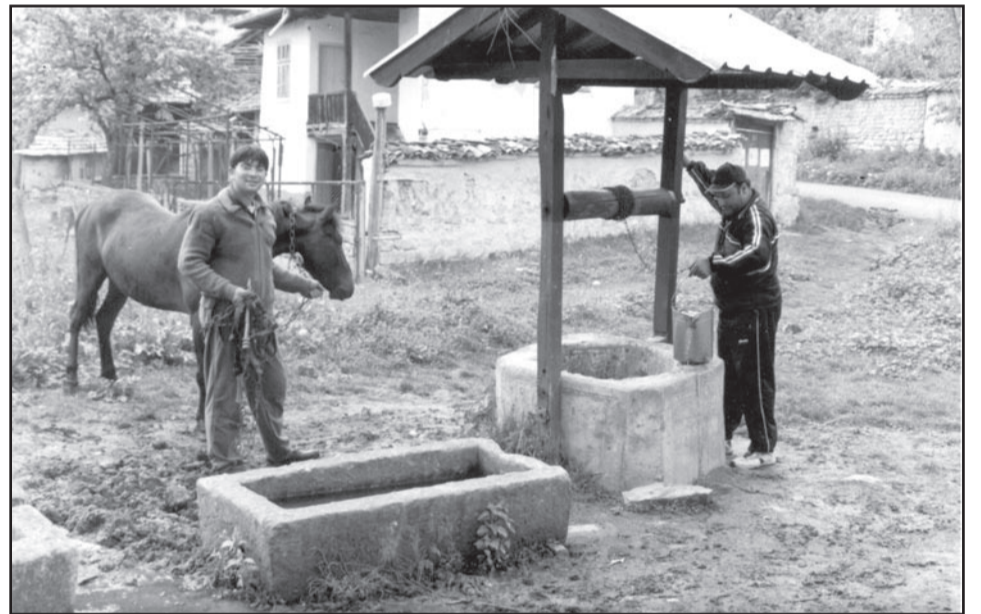
Възстановеният и почистен кладенец вече се използва за водопой на животните.

Планирали бяхме да направим и поставим в централната част на се-