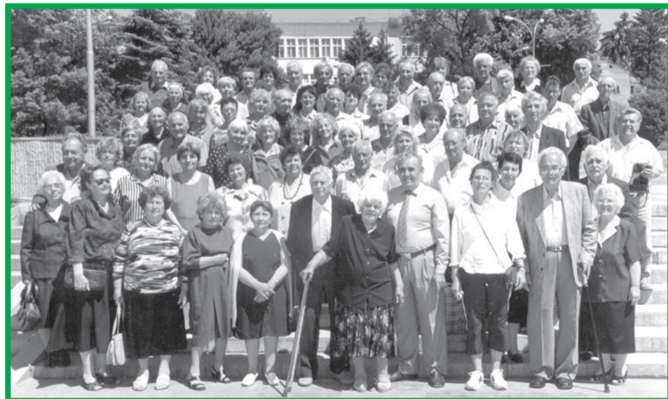
Участниците в третата земляческа среща на посабинчани