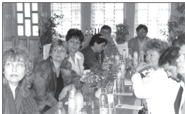
Част от участниците в представянето