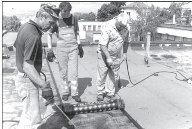
Ремонтът на покрива започна на 1 юни и се извършва от специализирана група към строителната фирма на ЕТ „Лимо-Сашо Събев“. Ако времето е благоприятно, очаква се работата да приключи за десетина дни.

що в елинсталацията и причинява аварии. Предвиждаме до края на годината да приключи изцяло ремонтът – външен на покрива и вътрешен на помещенията под него. За целта са осигурени 15 хиляди лева от Министерството на образованието и науката. В парното и пералното помещение не е пипано нищо от земетресението през 1986 година поради липса на финансови средства. Вътрешен ремонт ще направим на източното крило, където се помещават спалните помещения и занималните на две групи. Целта е през следващата 2005–2006 учебна година да осигурим условия за нормален учебен процес на нашите възпитаници.