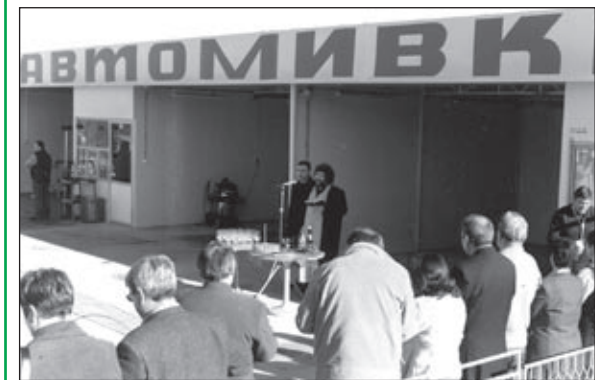
Момент от откриването на автомивката в Търговище