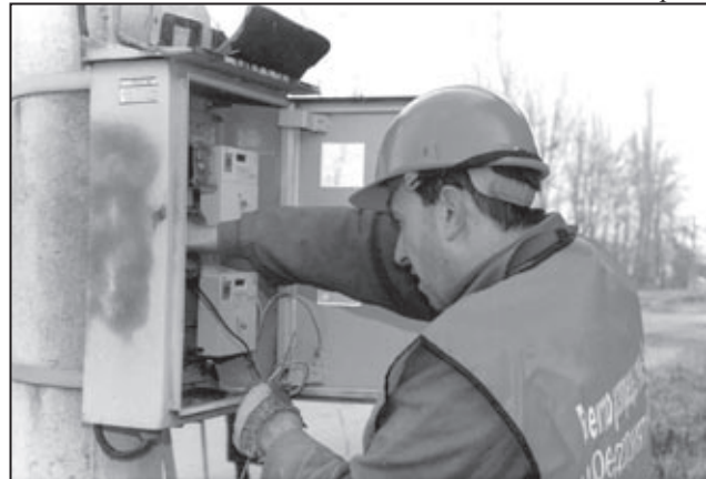
Техници от аварийна група към поповския район на „Електро-разпределение“ ЕАД-Варна работят по дооборудването на изнесените извън жилищата ел.табла по ул. „Земеделска“.