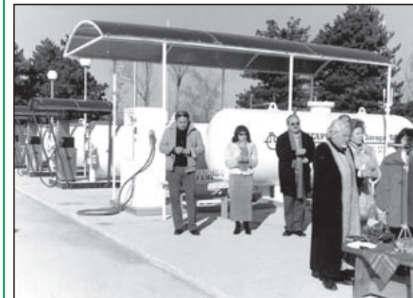
Момент от откриването на бензиностанцията в Попово