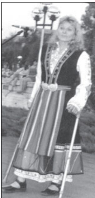
Песните ѝ огласяха площада на Опака по време на тържествата по случай 20-годишнината на града

Днес тя си спомня и разказва за една любопитна своя изява. През 1978 и 1979 година ходи на лечение в санаториума „Момин проход“ край Костенец. Една вечер с компания влиза в пълния с клиенти ресторант-градина „Момин проход“. Намират свободна маса до тази на музикантите, които тъкмо в него момент разбират, че са останали без певица, и коментират на глас ситуацията. Човек от групата на гърчиновското момиче къде на шега, къде сериозно плахо подхвърля предложение за изход от затруднението. Най-решителният от мъжете с ки-