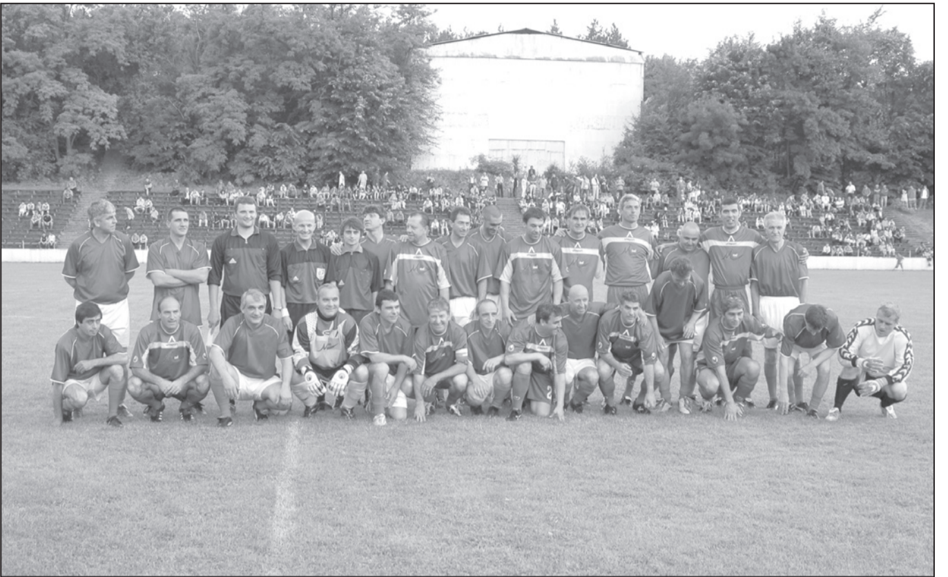
10 юни 2006 г. Отборите на „Черноломец“ и „Левски-1914“, възкресили спомена за първия финал за купата на Съветската армия.

По повод 60 години от първия финал за Купата на Съветската армия, игран между отборите на двата клуба през 1946 г., и Празника на Попово бе играна футболна среща между ветераните от „Черноломец“–Попово и „Левски-1914“–София. Мачът бе организиран от Община-Попово, фен клуба на „Левски“ в града и ПФК „Левски“–София.