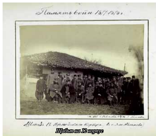
Щабът на 12 корпус

Интересна подробност е, че същата вечер в този район за първи път са направени изпитания в бойни условия на изобретените от руския учен гене-