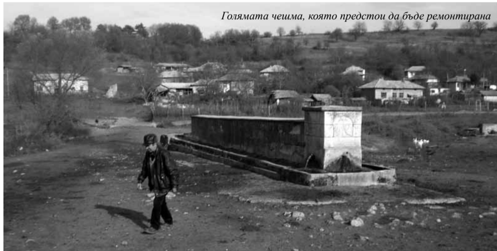
Голямата чешма, която предстои да бъде ремонтирана

На този ден организирахме тържество с участието на самодейни състави от Попово.