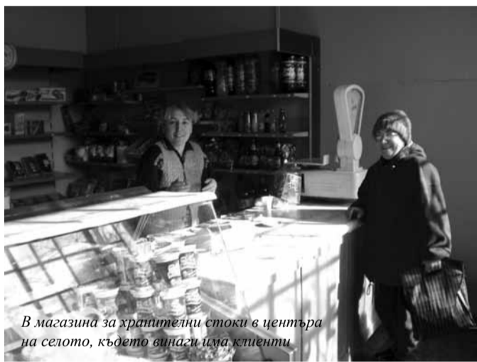
В магазина за хранителни стоки в центъра на селото, където винаги има клиенти

Обичам си работата и съзнавам важността на кметската професия. Близо 20 години трудовото ми всекидневие е било свързано с хора, сега отново е така, но отговорностите