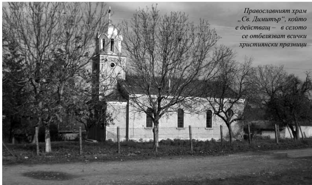
Православният храм „Св. Димитър“, който е действащ – в селото се отбелязват всички християнски празници

Извършен бе ремонт на една от селските чешми. Успяхме да оградим градинките в центъра, засадохме в тях дръвчета. Хората навреме са снабдени с дърва за огрев и спо-