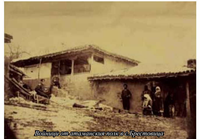
Войници от атаманския полк в с. Брестовица

Висока оценка на ингушкото участие в Освободителната война дава ген.-адютант Дондуков–Корсаков, който на 2 септември 1878 г. издава в Пловдив специална заповед – благодарност на Терско-планинския конен полк.