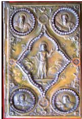
ЧЕТВРОЕВАНГЕЛИЕ, предна корица