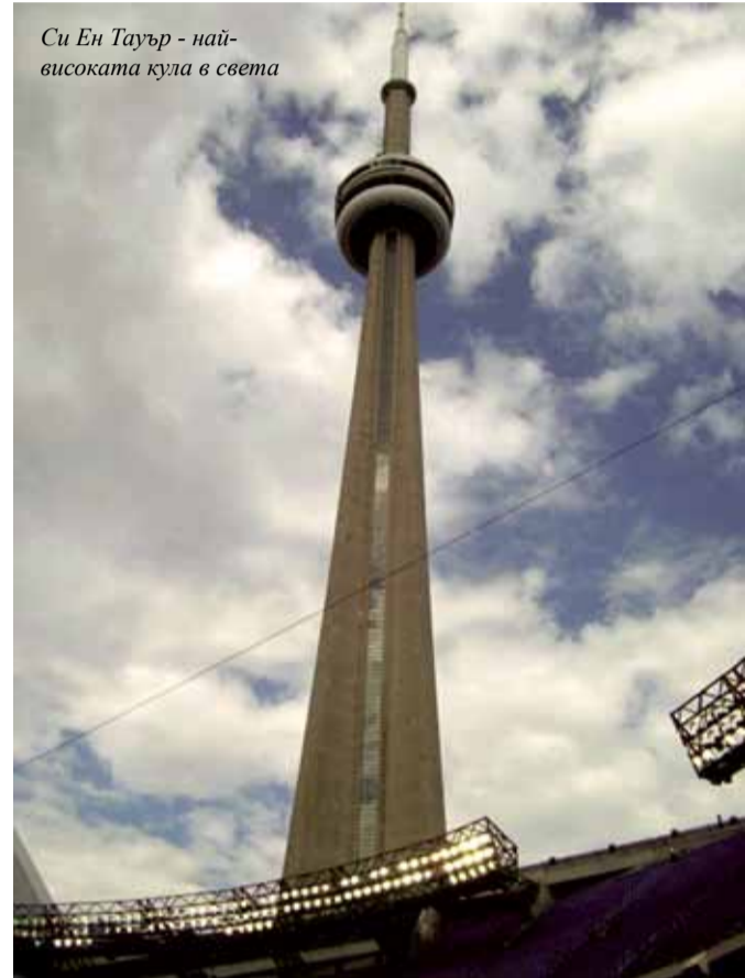
Си Ен Тауър - най-високата кула в света

ления от тази „далечна“ за някои страна. Историата на тяхното семейство е доказателство, че светът е малък. И най-далечните разстояния са преодолими. Българите са навсякъде. Разселване, започнало много преди транспортът и комуникациите да стигнат днешните си измерения.