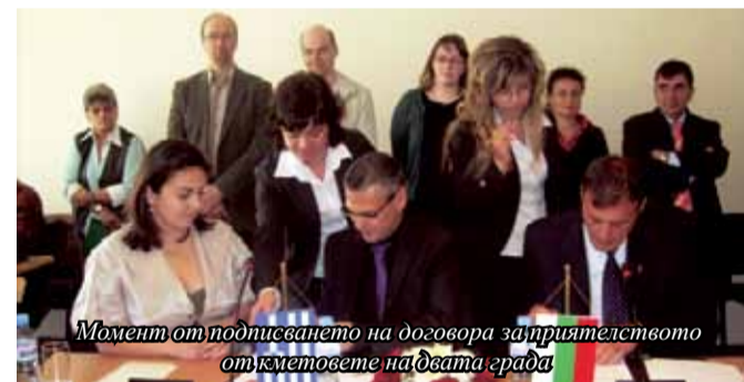
Момент от подписването на договора за приятелството от кметовете на двата града

ководени от препоръките на европейската Харта на местните власти и съобразявайки се със своите законодателства, двете страни се споразумяха отсега нататък да работят за развитието на взаимноизгодно сътрудничество и координацията на дейности, насочени към укрепване на връзките в сферата на икономиката, културата, административното обслужване и туризма между хората от двете общности.