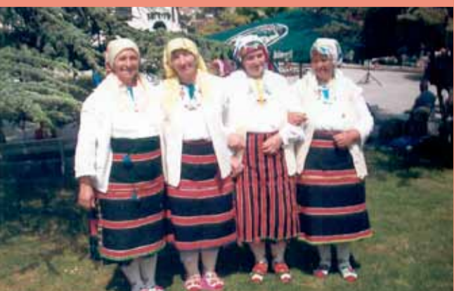
Групата за помашки фолклор