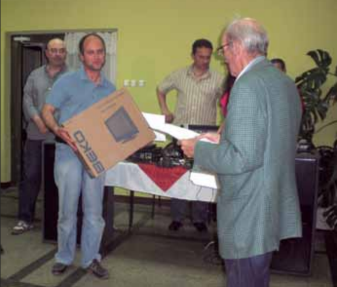
Посетителят на Голямата награда на ТВ „СКАТ“