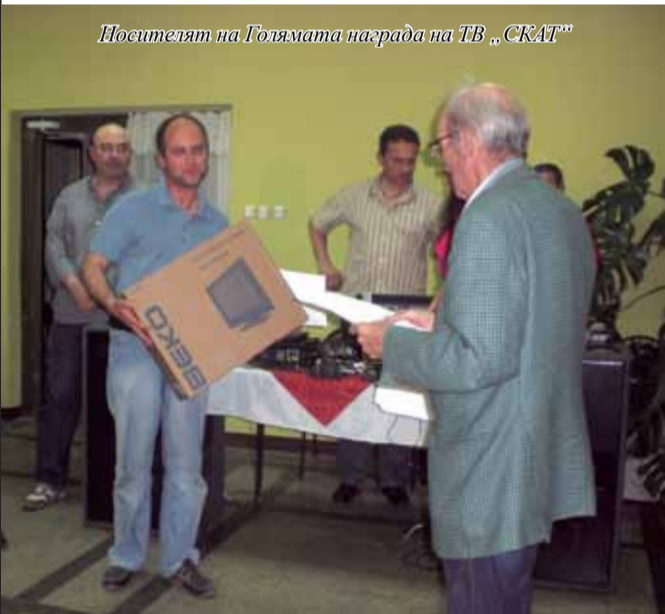
Посетителят на Голямата награда на ТВ „СКАТ“