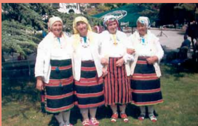
Групата за помашки фолклор