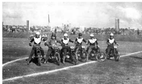
Попово, октомври 1961 г. Първо републиканско първенство по мотобол