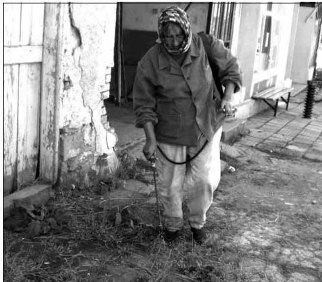
Наскоро жителите на кв.Сеячи проведоха кампания за почистване на селището. С доброволно събрани пари бе купен препаратът „Раундъб“ против плевели, с който бяха обработени и християнските, и мюсюлманските гробищни паркове. Напръскана бе и тревата по някои от улиците в централната част на квартала.

В състезанието участваха четири отбора с по четирима представители на четирите училища. В тренинговите игри и решаването на казуси те показаха на журито и родителите си, че младите хора в Попово имат знания по темата за сексуално и репродуктивно здраве. Така организаторите, а и всички подрастващи в общината провокират интереса на своите родители и им дават свобода за бъдещи разговори вкъщи на такива теми.