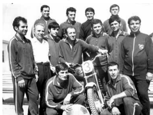
Гр. Елиста, Калмицка автономна република – СССР. Европейско първенство по мотобол. Националният отбор на България, класирал се на трето място: най-горе от ляво на дясно:

В периода 1972–1982 г. не е сформирани национален отбор и страната няма международни изяви. През 1972 г. отборът на Попово е републикански вице-шампион, но за следващите четири години той три пъти печели шампионската титла. За четвърти път поповските мо-