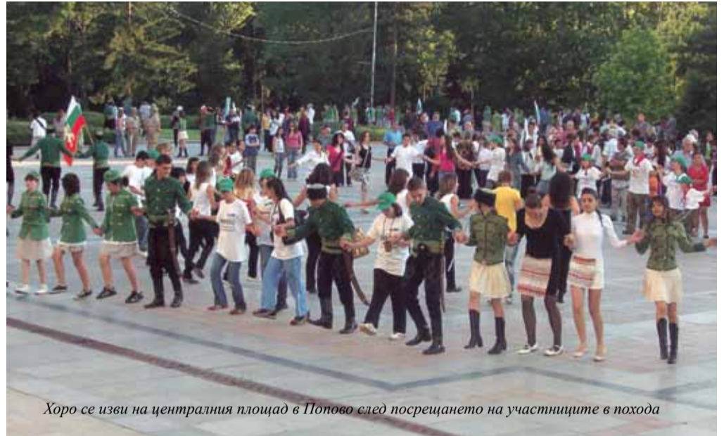
Хоро се изви на централния площад в Попово след посрещането на участниците в похода