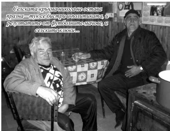
Селската кръчма никога не остава празна – тук се бистри и политиката, и резултатите от футболните мачове, и селските клюки...

Попово имаме, но само два дни в седмицата – понеделник и петък. Основната причина е, че селото ни е отдалечено – то е на 25 километра от града и е последното на територията на общината в западна посока. Освен това през последните десетилетия все повече намалява броят на пътуващите.