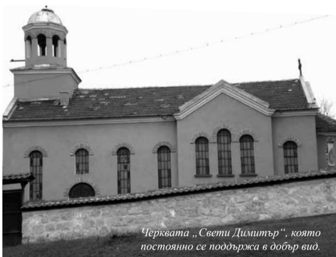
Черквата „Свети Димитър“, която постоянно се поддържа в добър вид.

Селото ни е сравнително малко, сега тук живеят около 180 души. Населението е смесено – българи и цигани. Млади хора почти не останаха. Между представителите на различните етноси никога не е имало разногласия на етническа основа. По различни поводи се събираме да празнуваме заедно. От две години отбелязваме празника на селото, който