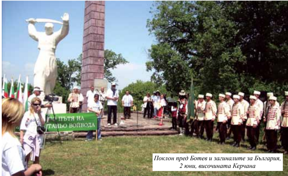
Поклон пред Ботев и загиналите за България, 2 юни, височината Керчана