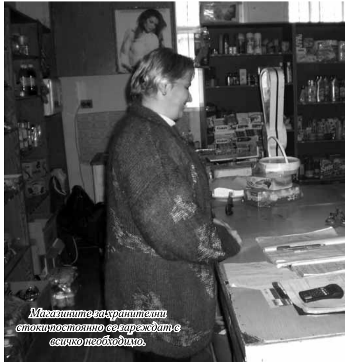
Магазините за хранителни стоки постоянно се зареждат с всичко необходимо.