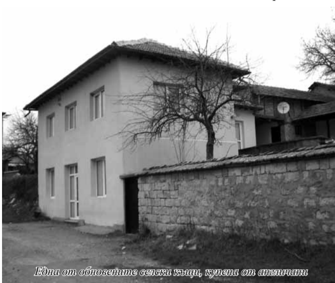
Една от обновените селски къщи, купена от англичани

новъдството. В землището на селото има 12 000 декара обработваема земя, която се стопанисва от земеделската кооперация и от