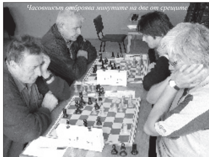
Часовникът отброява минутите на две от срещите