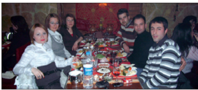
Ресторант „Махзен“ в Истанбул

Има много успели преселници в Истанбул. Даже без да преувеличавам, искам да споделя, че са повече, отколкото съм очаквала. Живея тук вече десет години, познавам много хора, някои от които заслужават да им се сваля шапка, както си казва, защото условията, в които те пресупяват, са много по-трудни в сравнение с тези, в които са свикнали да работят по „български“ наши съграждани. Режимът тук е друг, нравите – също, законите са дру-