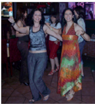
Ресторант „Махзен“ в Истанбул