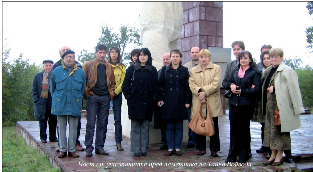
Част от участниците пред паметника на Таньо Войвода