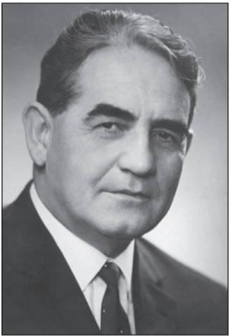
Ангел Цанев като министър

През 1971 година на миналия век МВР се оглавява от генерал Ангел Цанев – кадър с изключително стремителна кариера в партийната и държавна номенклатура. Партизански командир и с богат актив в антифашистката борба, Цанев последователно е заместник-министър на вътрешните работи и първи заместник-министър на строежите. От 1965 до 1971 година той е шеф на стратегически важния военновъздушен отдел в ЦК на БКП. През