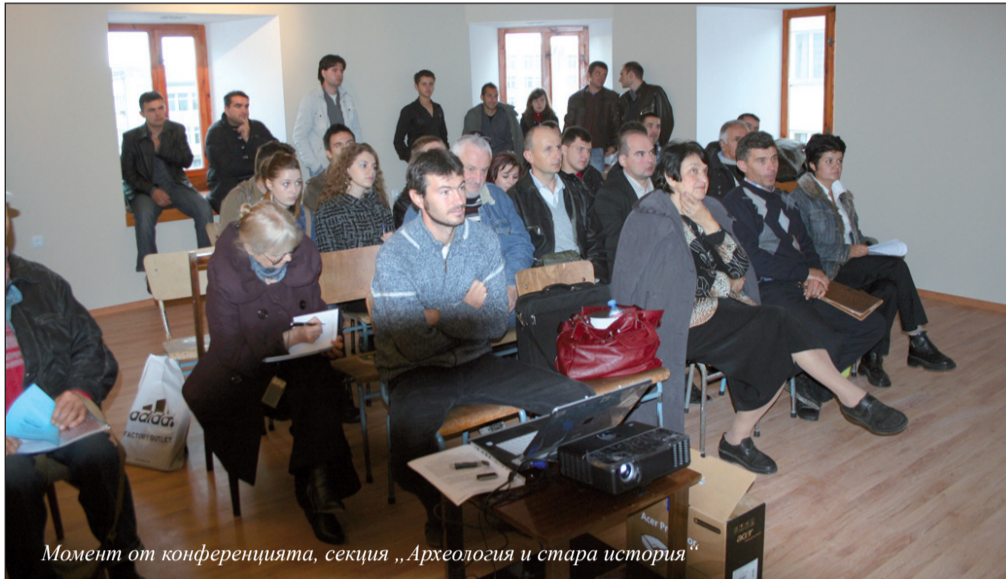
Момент от конференцията, секция „Археология и стара история“