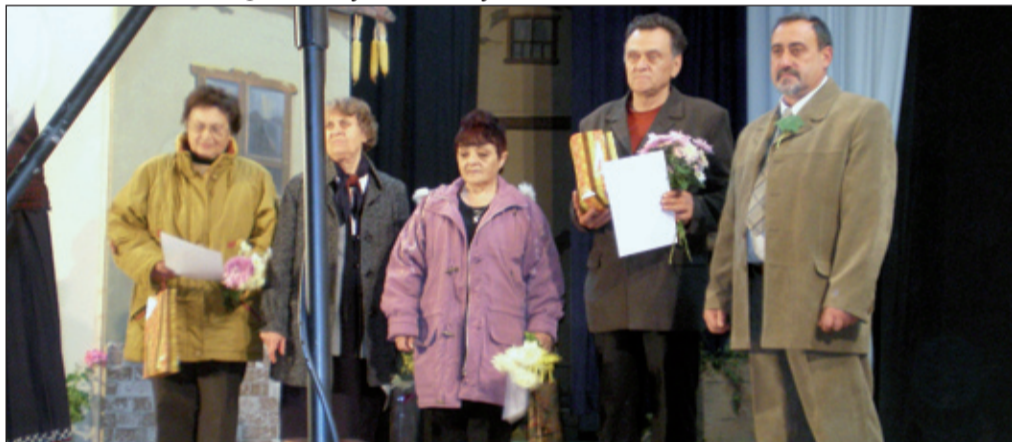
Носителите на грамоти по повод Деня на народните будители