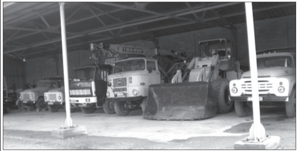
Част от техническия парк на дружеството

За следващата година са заложени 10 млн. лв. за ремонтни дейности по напоителната система за целия Търговишки регион, а само за Попово сумата е 2 млн. лв. Акцентът ще падне върху ремонта на поповския дюкер, който ще