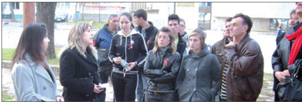
Участниците в похода, посетиха ожамията Ибрахим паша, строена през XVI век. Днес тя е истинска архитектурна и историческа забележителност, очакваща основен ремонт и реставрация.

Завърши тринадесетият поход „По пътя на шейх Бедреддин“, организиран от Културно-просветно дружество „Родно Лудогорие“. Тазгодишното му провеждане е част от проекта „По следите на миналото – за достойно бъдеще“, финансиран от Европейския социален фонд по оперативна програма „Развитие на човешките ресурси“. Проектът беше защитен пред Министерството на образованието, младежта и науката по схема за предоставяне на безвъзмездна финансова помощ „Да направим училището привлекателно за младите хора“ и официалното му представяне, ще припомним, беше направено в Попово на 2 октомври, а нашата Община е един от съорганизаторите. Одобреният за него бюджет от 344 000 лв. засега е най-големият по тази схема в ця-