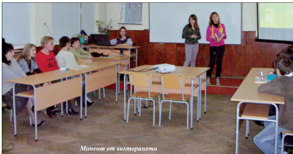
Момент от викторината