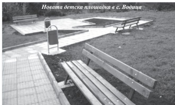
Новата детска площадка в с. Водица

През 2008 г. Община-Попово кандидатства с проекти по националната кампания „За чиста околна среда“. Темата беше „Почистване на населените места и облагородяване на почистените терени“, а финансирането – от Предприятието за управление на дейности по опазване на околната среда.