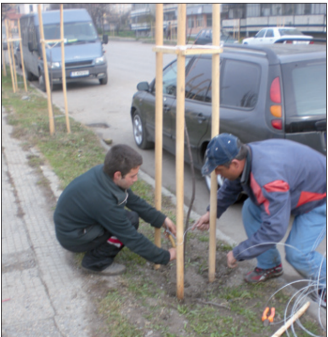
Работници от общинска служба „Озеленяване“ възстановяват нанесените щети.

Взето е решение за бъдеща съвместна дейност по утвърден график на служителите от общинското охранително звено и полицията за опазване на засадените декоративни дръвчета. МВ