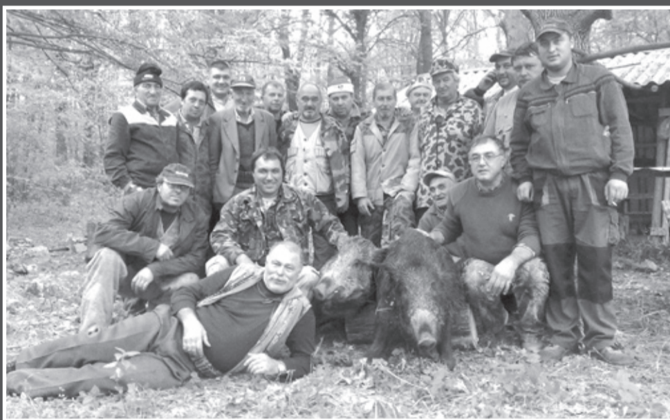
Тазгодишният ловен сезон на дивя свиня, ловците от дружинката в село Медовина са сред малкото щастливци. Снимката е от последният им щастлив излет.